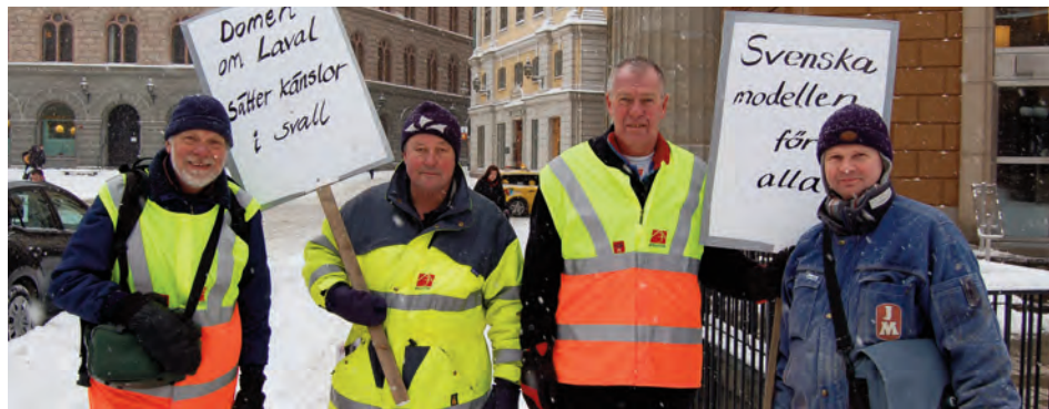
Byggnads protesterar för att svenska kollektivavtal ska gälla.

I kommunerna har det i brist på satsningar på dessa grupper vuxit upp stora arbetsmarknadsorganisationer som exempelvis i Gislaved. Där har man en verksamhet med olika former av uppdrags- och legoverksamhet för runt 100 personer. Dessa arbetar heltid och har i de allra flesta fall Fas 3-ersättningar, aktivitetsstöd för personer upp till 24 år samt vanligt aktivitetsstöd för övriga åldersgrupper. Detta innebär att dessa människor arbetar heltid, åtta timmar varje dag, för en månadslön på 3 000 kr upp till runt 6 000 kr. Detta kan rimligtvis inte vara ett humant sätt att behandla människor på.