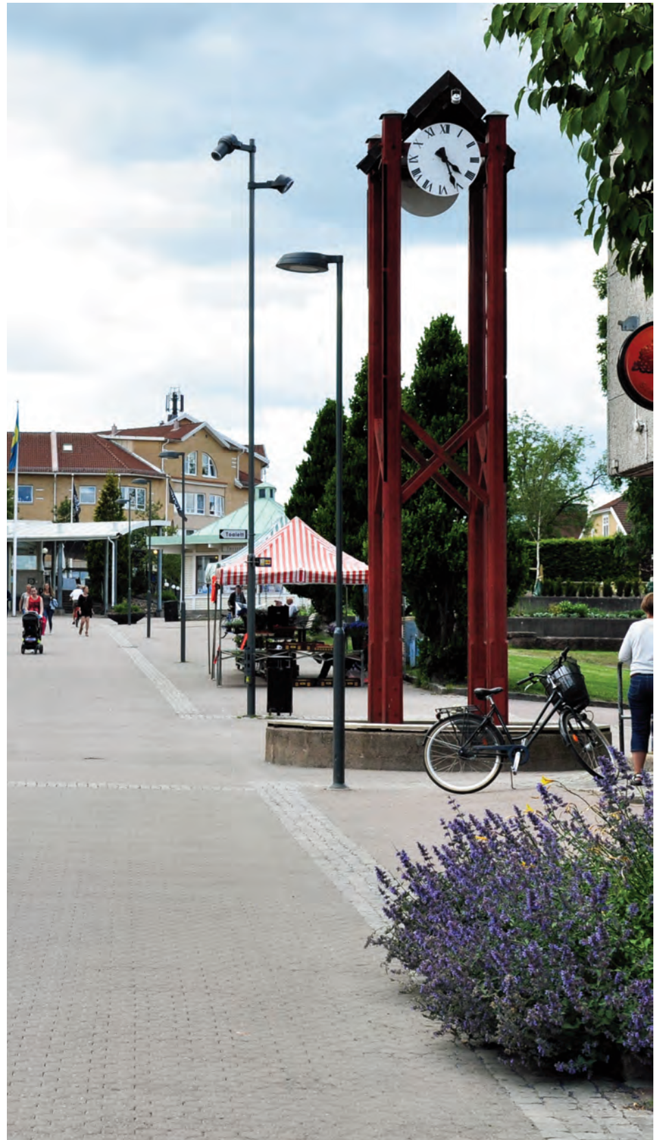
Kommunistiska Partiet säger nej till att tillåta biltrafik vid Klockstapeln.