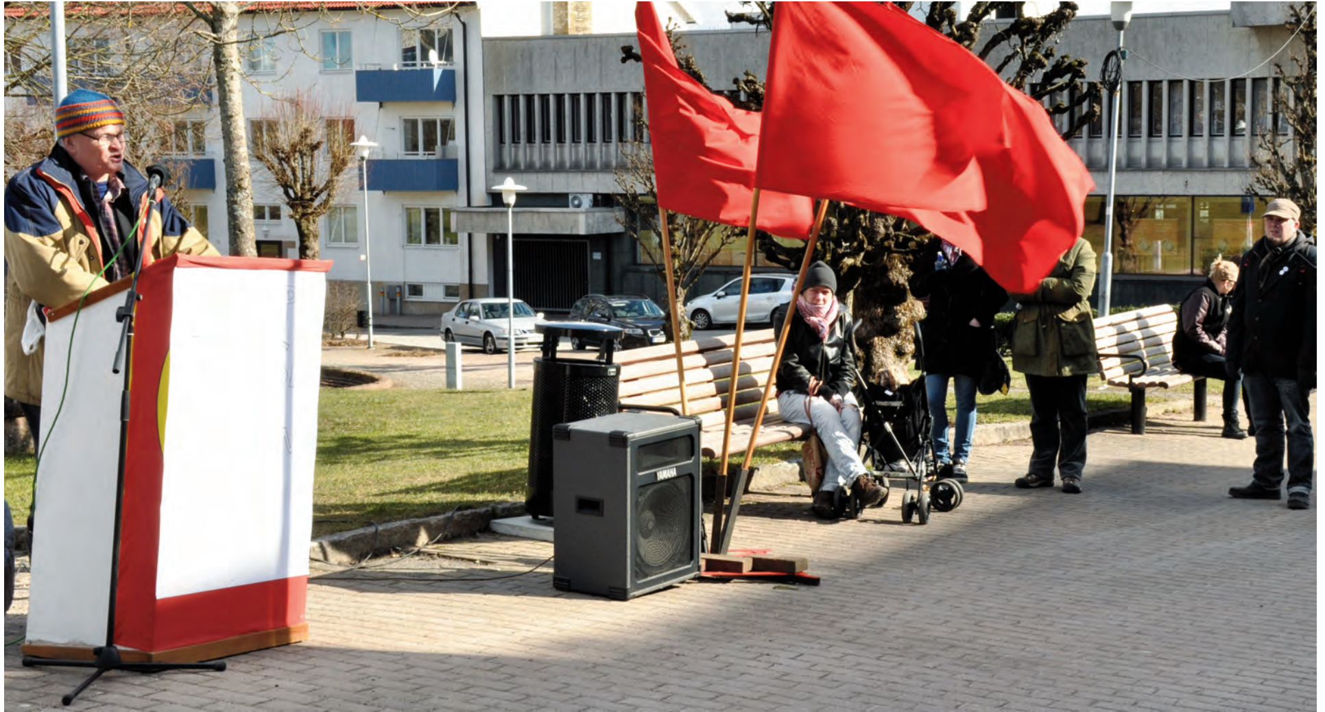
Kommunistiska Partiet i Gislaved håller torgmöte för att protestera mot nazisternas attack mot deltagare i en feministisk demonstration i Malmö.