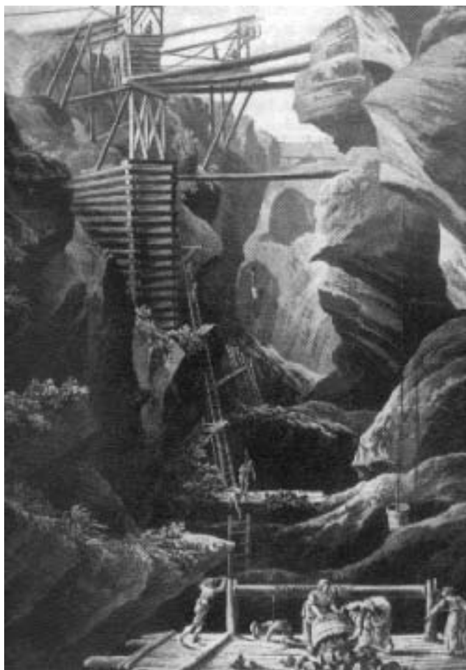
När gruvnäringen växte deltog även familjens kvinnor i malmbryt-ningen som gruvpigor.

Sedan kom 1600- och 1700-talet och kvinnans ställning försäm-rades generellt. Men för att förstå den ideologiska förändringen måste man sätta in kvinnohistorien i ett större ekonomiskt sam-manhang. Det feodala samhället var förhållandevis svagt utveck-lat i Sverige jämfört med resten av Europa, men i slutet av medel-tiden stärktes de största jordägarfamiljernas makt. Kontrollen över viktiga näringsgrenar som gruv- och malmhantering koncen-trerades på färre händer. Det började skapas ett proletariat på